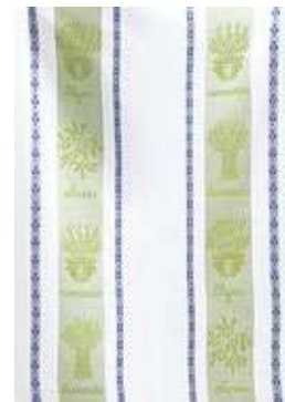
ST RÉMY AMANDE