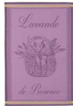
PANIER DE LAVANDE