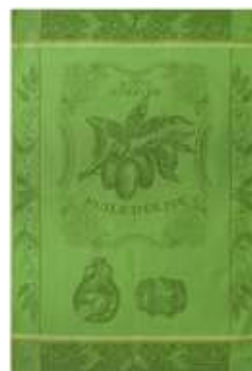
HUILE D'OLIVE SURFINE