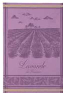
CHAMPS DE LAVANDE