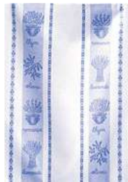
ST RÉMY LAVANDE